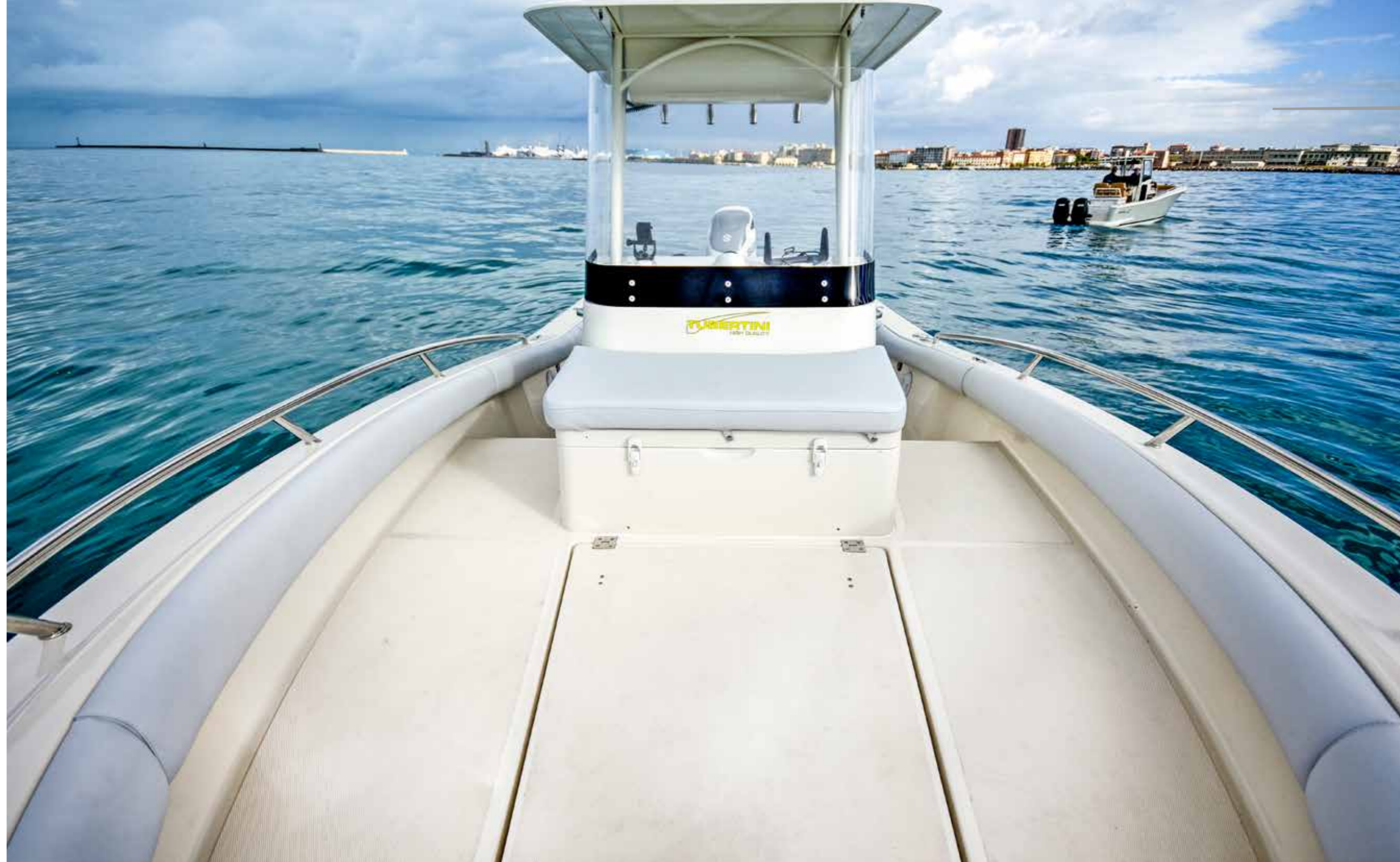
Tuccoli T250 VM

A bordo del T250 VM, grazie alla sua carena, si può contare sulla stabilità dello scafo quando si è all'ancora o se si scivola pescando in drifting.